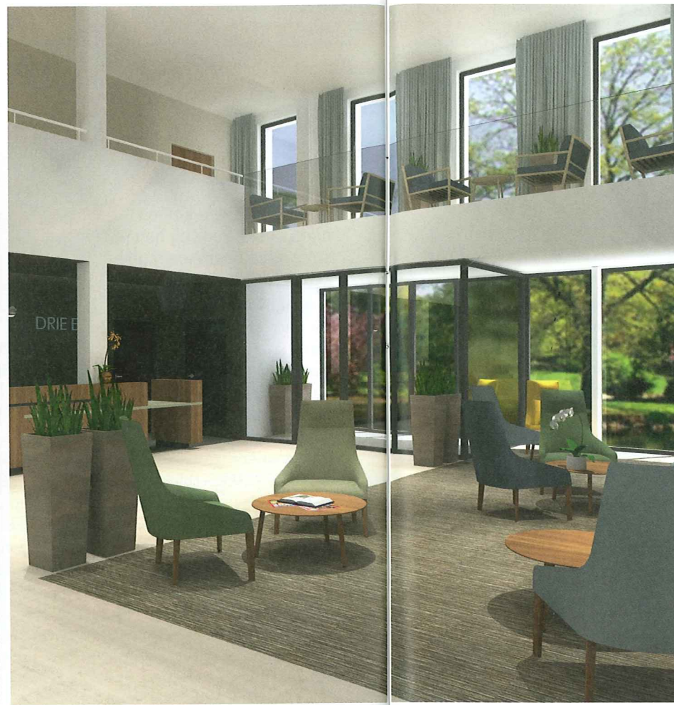
De gasten kunnen genieten van heel wat comfort, zoals luxe kamers met internetverbinding en digitale televisie, room service, een fitnessruimte, een kappers- en beautysalon, een zonneterras ...