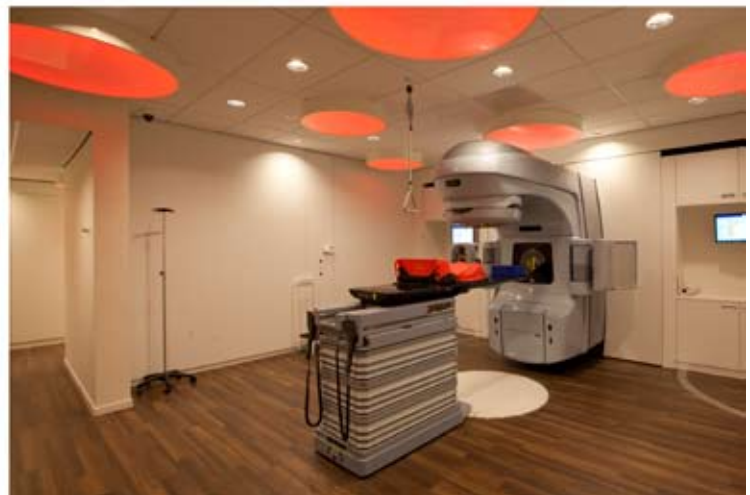
De ambiance van de bestralingsruimte is naar wens van de cliënt qua lichtkleur en -intensiteit te bepalen.

biedt de mogelijkheid om verschillende wacht-ruimten met elkaar te verbinden, terwijl de vormgeving iedere wachtruimte zijn eigen karakter geeft. Vanuit de receptie is overzicht op de verschillende wachtruimten, waardoor patiënten altijd in directe nabijheid een zichtbaar aanspreekpunt hebben. Ook het ondersteunend personeel blijkt tevreden. Hun 'gewone' werkplekken zijn helder, royaal en ruim voorzien van daglicht. Euser is blij met alle complimenten, maar deelt de eer onmiddellijk. "Een gebouw is altijd zo goed als de interactie tussen opdrachtgever en architect."